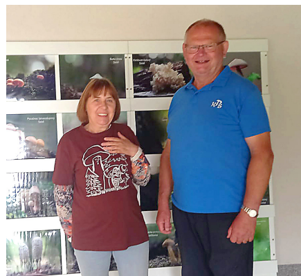
Soutěž Vesnice roku