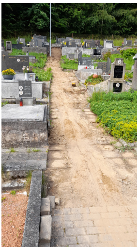
Hřbitov chodník, oprava propustek