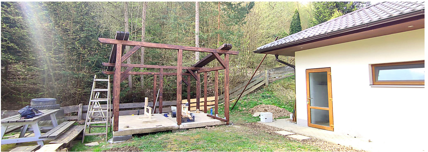
Sklad sezónních věcí